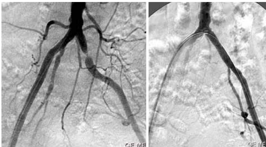
Röntgenbild vor (links) und nach der Stent-Therapie (rechts).

Frau Wessel ist 58 Jahre und wurde am 3. März 2012 mit seit einem Jahr auftretenden Schmerzen im gesamten linken Bein in eine Gefäßambulanz überwiesen. Nach ca. 200 m traten erst Waden- und dann aufsteigend Schmerzen bis zum Gesäß auf. Frau Wessel ist gering übergewichtig (Body-Mass-Index 26,7) und als Risikofaktoren bestanden der erhöhte Blutfettspiegel, das Zigarettenrauchen und eine positive Familiengeschichte für Herz-/Gefäßerkrankungen. Zusätzlich wurden die Beschwerden durch Kribbelmissempfindungen in beiden Beinen infolge eines Wirbelsäulenleidens über-